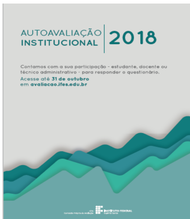
(Figura 6)