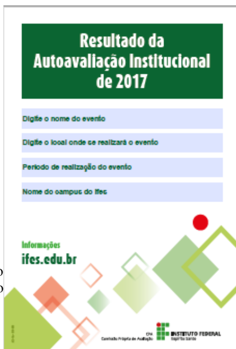
Figura 5 - Divulgação do Resultado da Autoavaliação Institucional de 2017